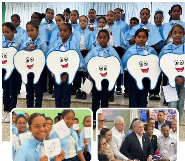
SNS inaugura consultorio odontológico y declara escuelas libres de caries en Moca