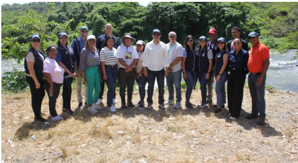
SRS Cibao Norte cierra la primavera con jornada de reforestación y limpieza en balneario Timberke